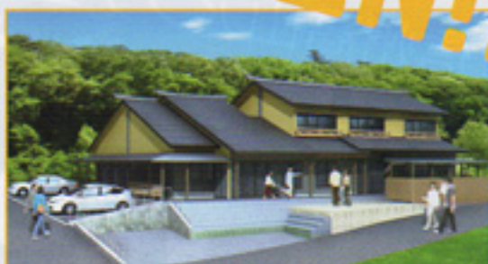
信州高山アンチエイジングの里 スパ・ワインセンター

「信州アンチエイジングの里スパ・ワインセンター」のアンチエイジングとは、「老化」・「加齢」に抵抗するという意味で、近年、少しでも老化の速度を遅くし、健康に加齢することに 관심이高まっています。また、 スパ は温泉のこと、 ワイン は高山村の農産物、特産品等の総称の意味です。愛称の「 スパイン 」はスパ・ワインセンターの省略形で、英語のスパインには、脊柱、背骨の意味があり、正に、高山村の基幹産業である農工商観光業の産業振興の活性化を図る施設としてふさわしい愛称となっています。このセンターは、高山村の観光情報等を全国に向けて発信するため、村のあらゆる産業の振興と魅力ある観光地づくりを進めるとともに、 本村の優れた地場産品や温泉、自然環境等を活用した健康づくりなどアンチエイジングの考え方を取り入れた観光の拠点施設であり、また大湯の休憩室としてもご利用いただける施設です。