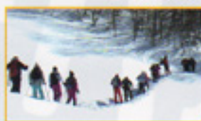
スノーシューハイキング